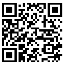
Bildungspaket im Kreis Bergstraße

Informationen zur finanziellen Leistungen rund um den Schulbesuch und der Teilnahme an Vereins- und Kulturangeboten finden Sie im Flyer " Bildungspaket im Kreis Bergstraße ", der unter anderem auf Deutsch und Russisch verfügbar ist.