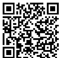
Google Play Store