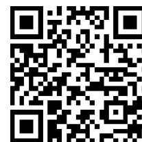
Bildungspaket im Kreis Bergstraße

Інформацію про фінансові вигоди, пов'язані з відвідуванням школи та участю в клубних та культурних заходах, ви можете знайти у флаєрі « Bildungspaket im Kreis Bergstraße », який доступний також на німецькій та російській мовах.